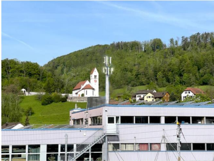
Der Aufbau der dargestellten Mobilfunkantenne ist nicht realitätsgetreu und dient lediglich zur Veranschaulichung des möglichen Ortsbildes mit Antennenkörper

Am 26. April 2023 fand in der March, auf Anregung vom Forum Dialog sowie auf Einladung der Gemeinde, eine öffentliche Podiumsdiskussion zum Thema 5G-Antenne auf dem GZG in Meltingen, statt. Mit rund 120 Besucherinnen und Besuchern, grossmehrheitlich alles Einwohner und Einwohnerinnen von Meltingen, stiess diese Diskussion auf sehr grosses Interesse.