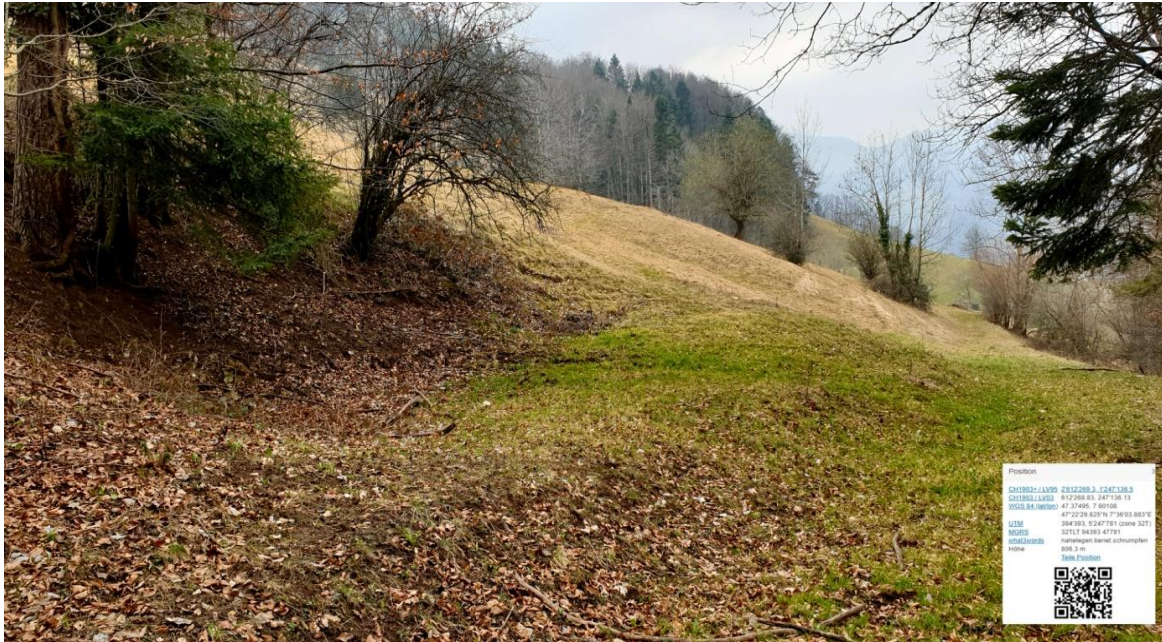
„Metallschmelzplatz“ am alten Weg zum Hof Möschbach