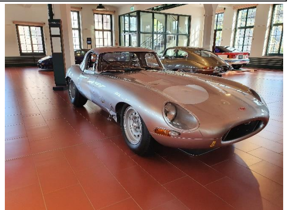
Jaguar E-Type Lightweight, Modell 1963, Baujahr 2014