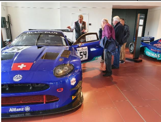
Jaguar RSR XKR Präsentation mit fokussierten Zuhörern

Wir bedanken uns ganz herzlich bei den Teilnehmern und hoffen, dass ihnen der Ausflug auch soviel Freude bereitet hat. Im kommenden Jahr ist wieder ein Ganztagesausflug geplant, welcher gerne durch Wünsche der Senioren mitgestaltet werden kann. Über Ihre Anregungen und Wünsche würden wir uns im Gemeindehaus sehr freuen.