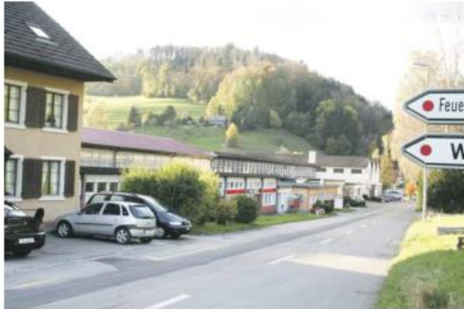
Nunningen, Grellingerstrasse 23 – 27