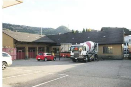
Nunningen, Grellingerstrasse 13 – 19